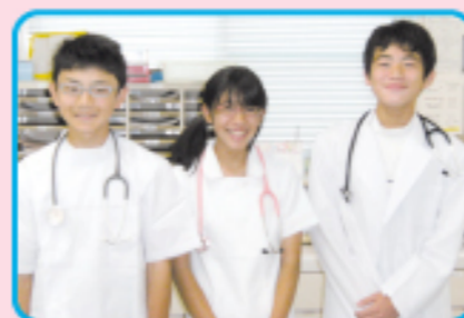
未来のドクターとナース

上京中学校の生徒さん3名が今年も当院へ職場体験に来られました。短い期間でしたが、看護師さん指導のもといきいきと体験されていました。