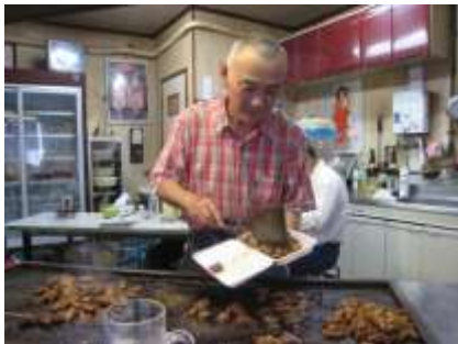
この匂いがたまらない！庶民派の名物ホルモンをつまみます！