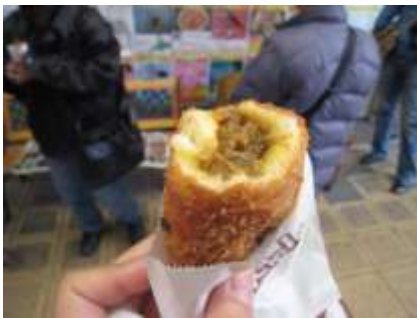
商店街 3 店舗のコラボ商品、揚げたての手作りカレーパンは絶品！