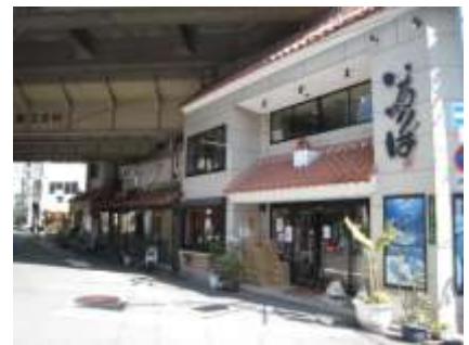
大正駅周辺には居酒屋がズラリ。沖縄名物ポークたまごもありますよ！