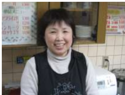
カレーパンを生んだカレー屋さん。パンの中身にはどんな工夫が？