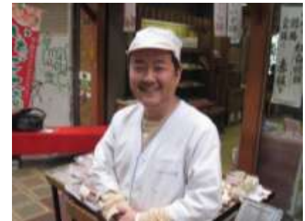
先代から地元まつわる銘菓を受け継いでいます。