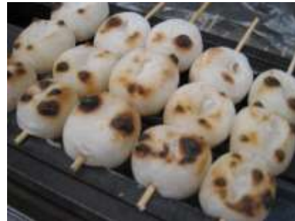
商店街の老舗和菓子屋で焼き立てお団子をいただきます。