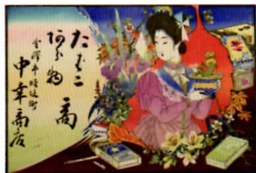
「引札(たばこあら物商)」制作年不明

平成29年10月10日(火)～10月13日(金) 開場時間:12:00-17:30 入場無料 場所:金沢美術工芸大学大学院棟2階展示室